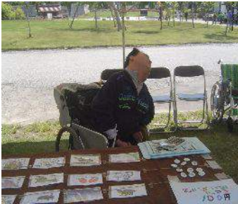
アースディとやまでオリジナル商品等販売