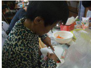
メンバー全員で昼食作り