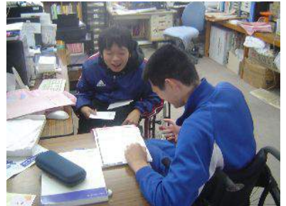
【特別支援学校の就業体験受入れ】 生きる場メンバーと打合せ中の様子