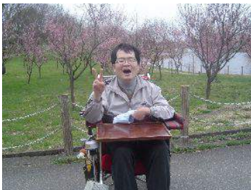
桜じゃない花と満面の笑み(笑)