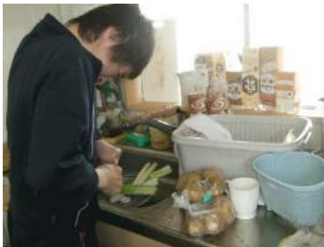
メンバー全員で昼食作り