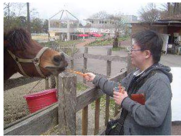
にんじんだよ♪お召しあがれ♪