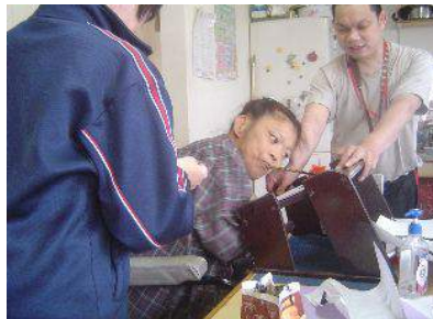
役割分担をして商品のデザインを作成中!!