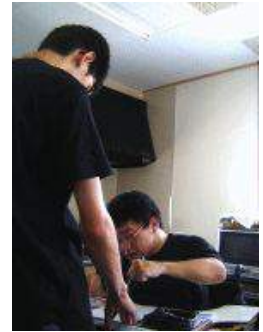
【高校生のボランティア受入れ】 生きる場メンバーの商品デザイン補助の様子

振込用紙を同封させていただきます。ご覧いただいた通り、会費・購読料以外の振込が同封の振込用紙ではできなくなりました。申し訳ないのですが、寄付金等につきましては郵便局備え付けの用紙でお振り込みいただくか、現金書留などの方法によりお願ひいたします。もちろん強制ではございません。皆様のお気持ちはお寄せいただくと幸いです。