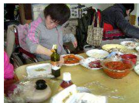
ピザ美味しくできたよ♪

生地をこねて、丸めて、伸ばして… トマトソース、たまねぎ、 エビ…あっ、次はハムものせて 最後は、チーズとパセリ!