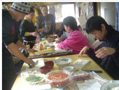
沢山の材料があって、下準備に大忙し