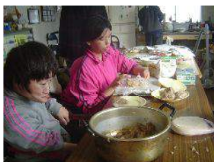
← ハンバーグ組♪ 180gに分けて丸めて…