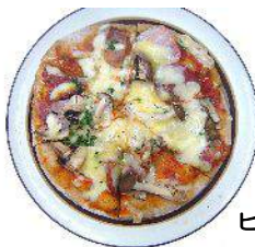
← ダッチ・オーブンで 焼くピザは最高に美味しかったです